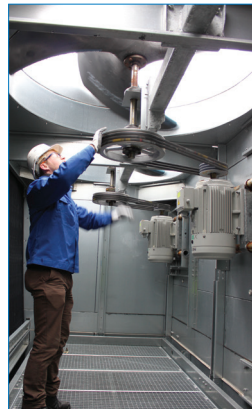
Система привода вентилятора легко доступна при стоянии