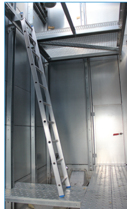
Внутренняя качающаяся дверь доступа, ведущая в просторную племуну