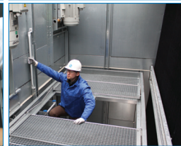
Внутренние сервисные платформы*