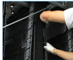
Патентованный наполнитель VACross, обеспечивающий легкий осмотр и очистку лист за листом